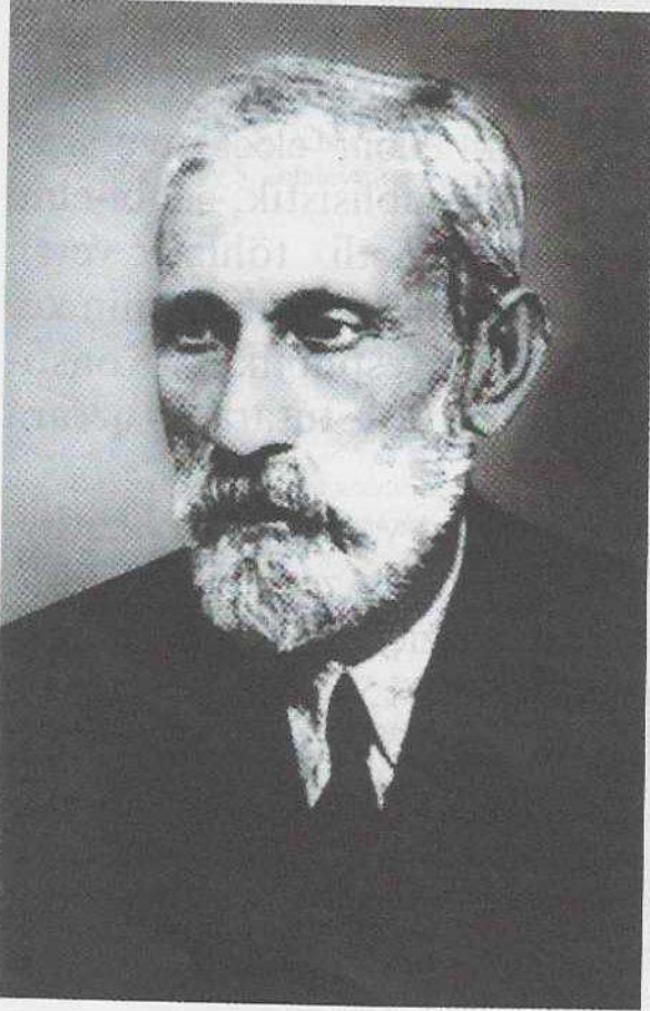
Əli bəy Hüseynzadə

Müəllif türkçülük məfkurəsinin yorulmaz carçısı, Azərbaycan xalqının böyük mütəfəkkiri, alim, yazıçı, maarifçi, publisist, rəssam, təbabət sahəsinin bilicisi Əli bəy Hüseynzadə haqqında tarixi faktlara əsaslanan dəyərli fikirləri oxuculara çatdırmağa çalışır.