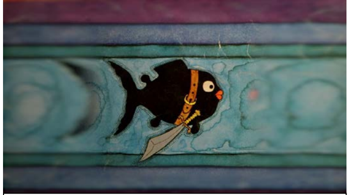
S.Behrənginin “Balaca qara balıq” hekayəsinə illüstrasiya

Ötən əsrin 60-cı illərində Cənubi Azərbaycanın bu tanınmış siması pedaqoji fəaliyyətində, bir qayda olaraq, türk mənşəli didaktik nümunələrdən istifadə imkanlarına da böyük rəvac vermişdir. O, məhz bu istiqamətdə xalq təfəkküründən süzülən şifahi və yazılı sənət nümunələrimizi təsnif edərək, gənc nəslin istifadəsinə çatdırırdı. Onun didaktik səciyyə daşıyan poeziya nümunələrindən uzun müddət Azərbaycan Respublikasının məktəblərində tədris-tərbiyə materialı kimi istifadə olunmuşdur.